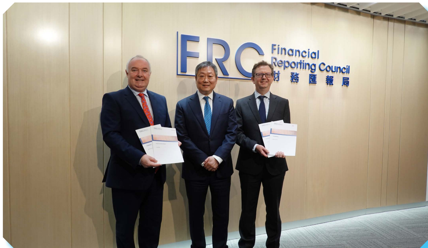
財匯局主席黃天祐博士(中)、行政總裁馬力先生(左)及查察部主管李斯先生與傳媒會面。

透過新聞發佈會公佈我們的監管發現，可讓財匯局有效履行法定職能，以及令受監管人士在上市實體的財務匯報及審計方面向公眾負責，亦讓本局就有關事宜教育公眾。