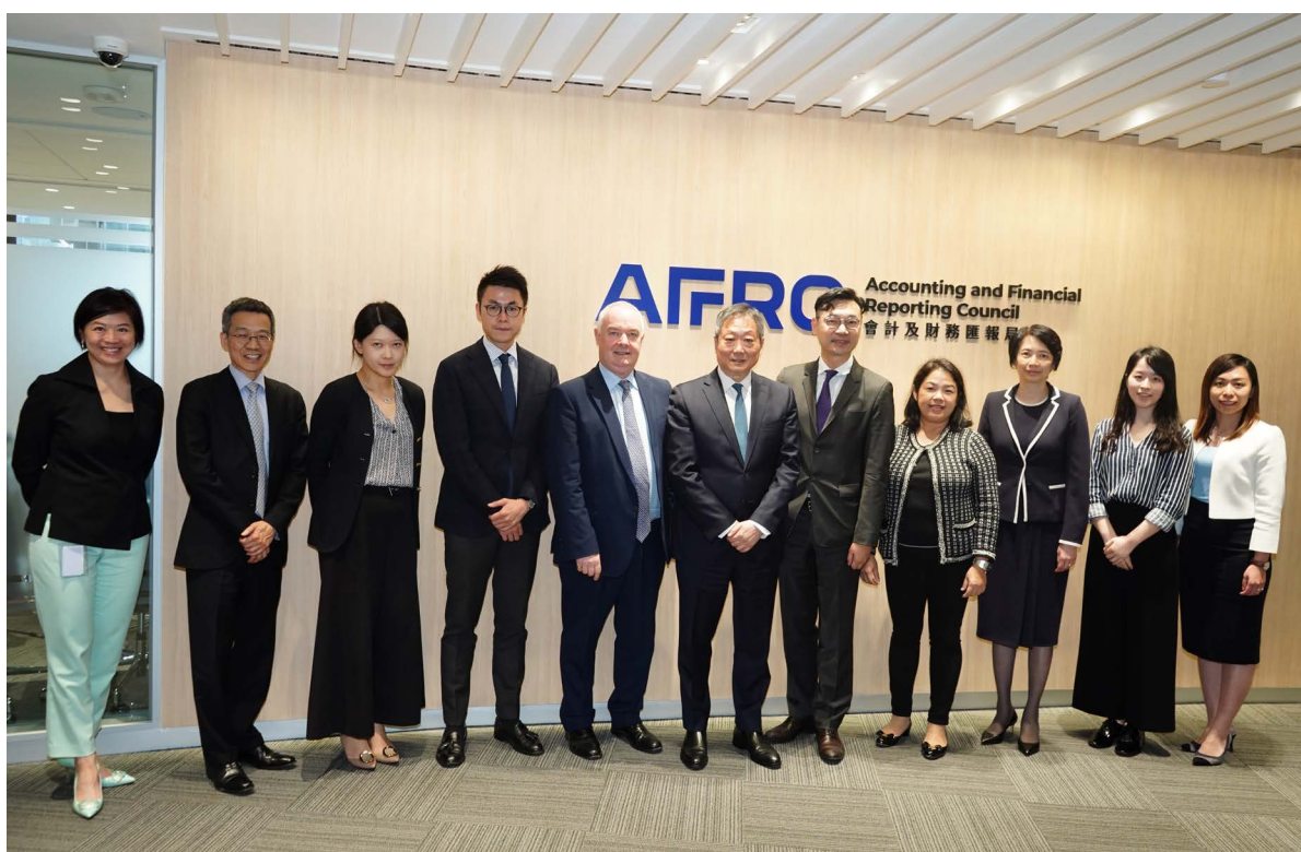
財經事務及庫務局副秘書長姜子尚先生（右五）到會財局進行禮節拜訪。

2023年5月17日，財經事務及庫務局副秘書長姜子尚先生到會財局進行禮節拜訪，會見了會財局主席和管理層向姜先生簡介自會計專業進一步改革實施以來，本局的最新發展、工作進展以及挑戰。