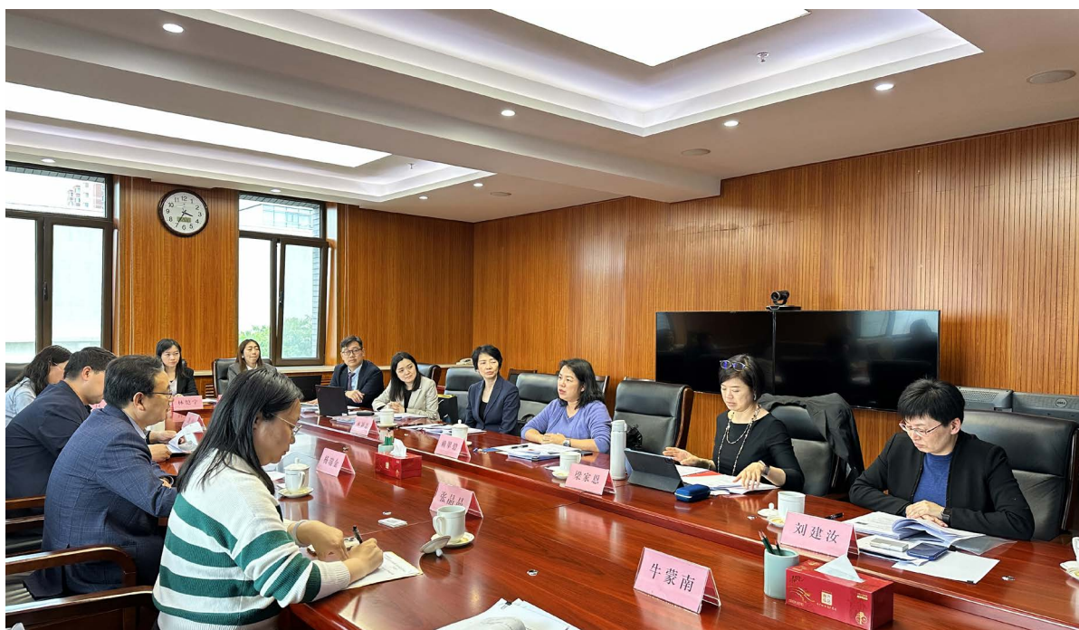
會財局代表團前往北京與內地監管機構進行了三天的拜訪活動。

此行不僅加強了內地與香港監管方式的相互了解，也為會財局與內地當局建立更全面的合作機制打開廣闊道路。