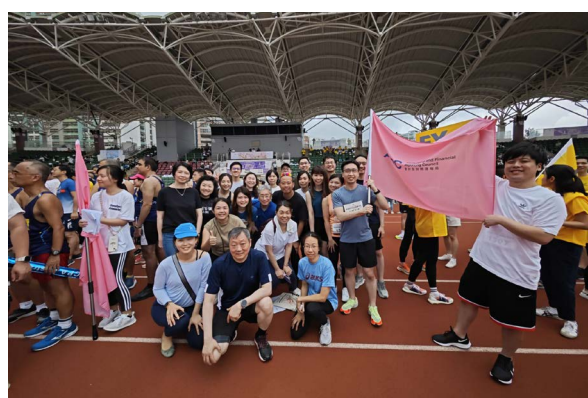
會財局於會計界運動嘉年華2023上展現「一團隊，一文化」精神。