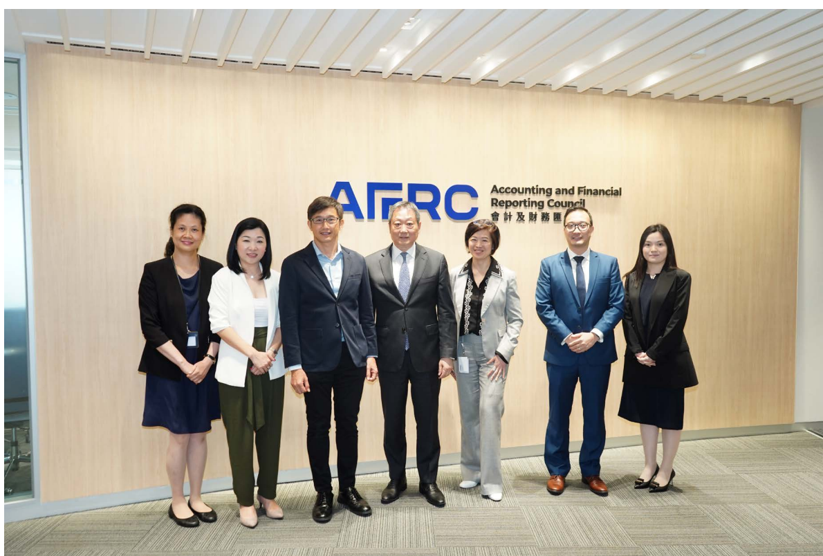
會財局與新加坡特許會計師協會就香港及新加坡的監管環境及會計市場交換意見。

2023年6月19日，我們接待了新加坡特許會計師協會會長張思樂先生及其團隊。會面期間，雙方分享了香港和新加坡監管環境和會計市場的狀況，以及資本市場對推動會計行業增長和創新方面的重要性。我們還就如何吸引和留住行業頂尖人才交換意見，並探討利用人工智能促進會計行業發展的潛力。