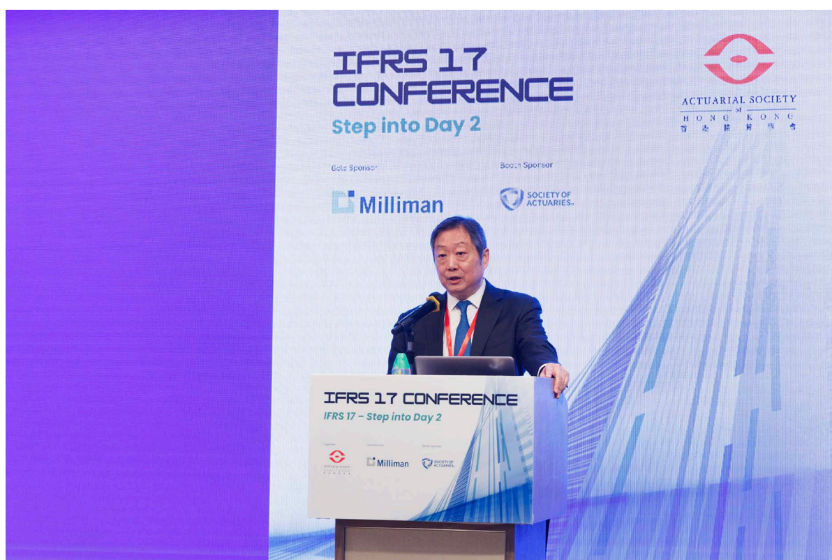
主席黄天祐博士在香港精算学会主办的《国际财务报告准则第17号》会议上发表主题演讲。

2023年10月25日，会财局主席黄天祐博士应邀在香港精算学会主办的《国际财务报告准则第17号》会议上发表 主题演讲 。黄博士向与会者分享会财局的转化历程，会财局与本地、内地及国际监管机构就维护香港资本市场诚信而进行的策略合作，以及精算师面临的挑战和机遇。