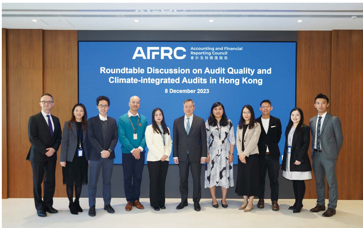
会财局与机构投资者、审计委员会成员和公众利益实体核数师举行了三场圆桌讨论。

在与审计委员会的讨论中，与会者表达了对核数师展示其价值观的期望，特别是在确保高质素审计方面。