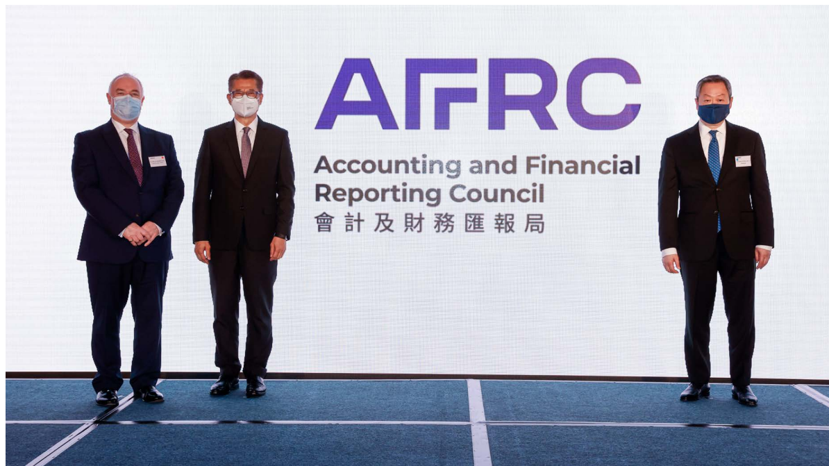
香港特別行政區政府財政司司長陳茂波先生 (左二)與會財局主席黃天祐博士 (右一)及行政總裁馬力先生 (左一)主持啟動禮，揭開會財局的新標誌