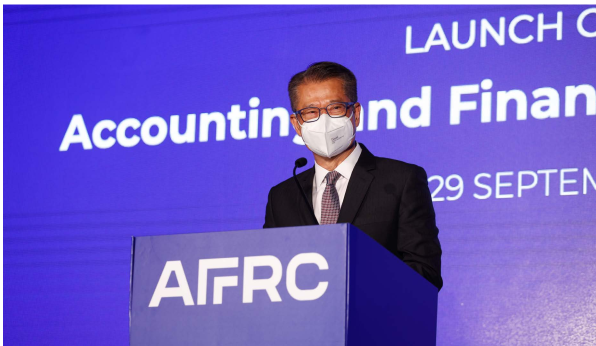
主禮嘉賓香港特別行政區政府財政司司長陳茂波先生致辭