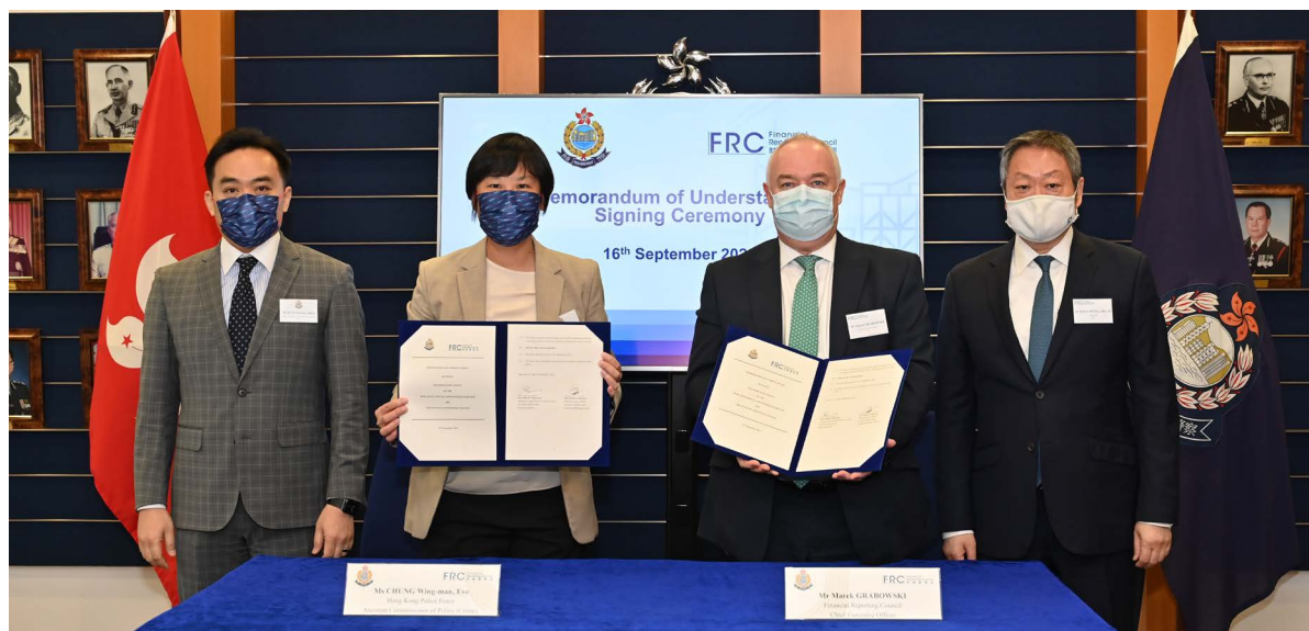
警務處與會財局簽署諒解備忘錄，加強合作以維護金融市場的誠信和公平。