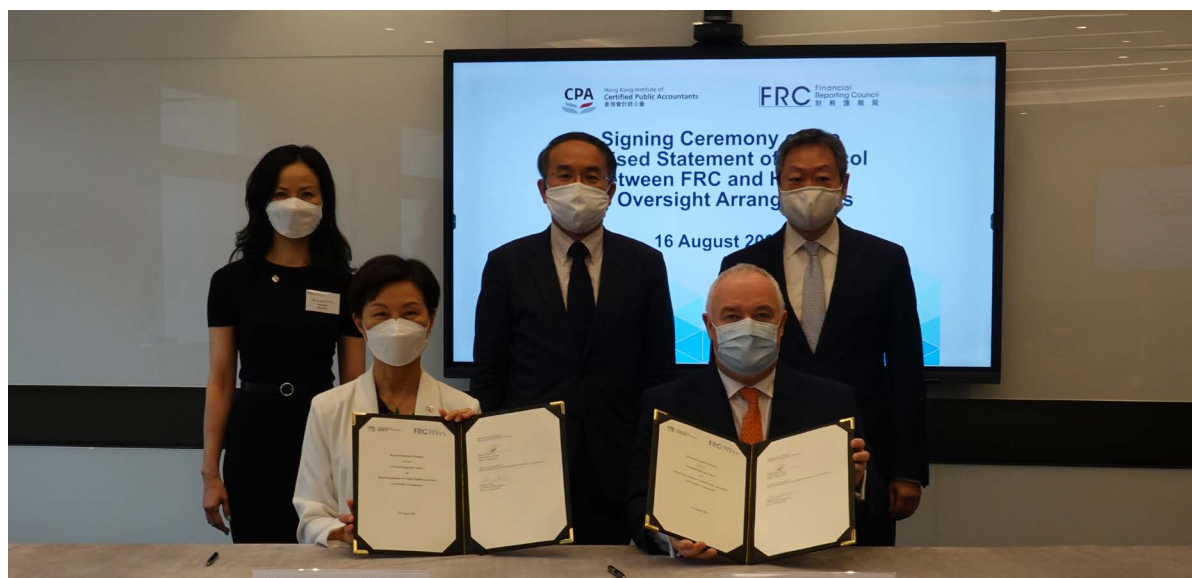
會財局和香港會計師公會簽署修訂監督安排協議聲明，並由財經事務及庫務局局長許正宇先生見證。

公會在維持會計專業準則和促進業界在香港的可持續發展方面發揮關鍵角色。會財局旨在透過修訂協議聲明，就其監督方式提供清晰和透明的方針，使監管更有效、責任更清晰和完整，從而提升公眾對香港財務匯報的信心。