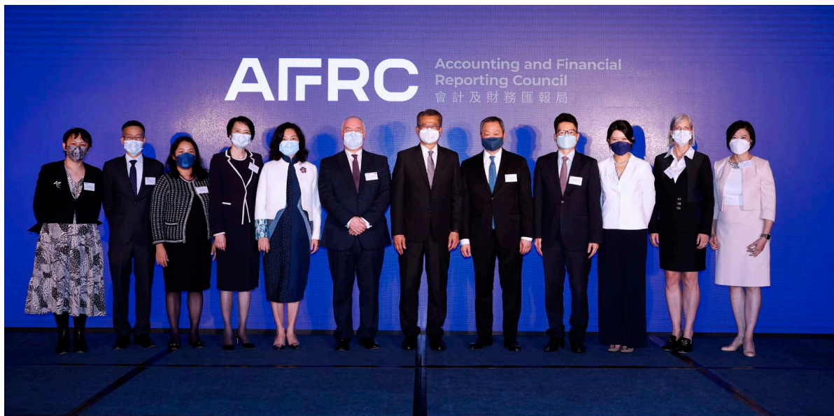
香港特別行政區政府財政司司長陳茂波先生 (右六)、署理財經事務及庫務局局長陳浩濂先生 (右四)及財經事務及庫務局常任秘書長(財經事務)甄美薇女士(左五)與會財局管理層合照