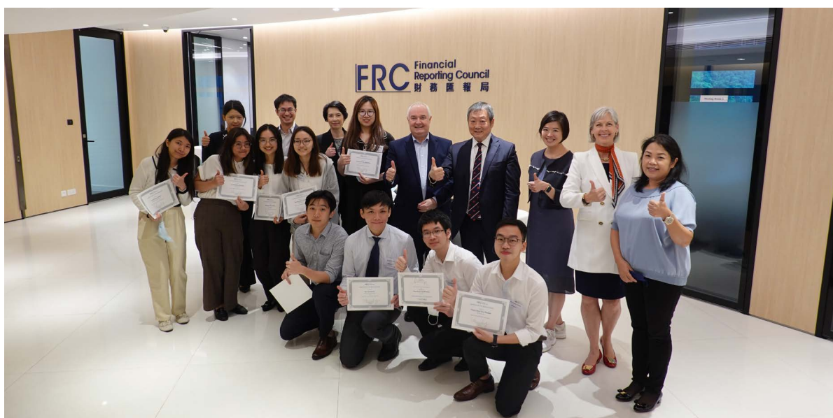
實習生均認為會財局暑期實習計劃具有啟發性