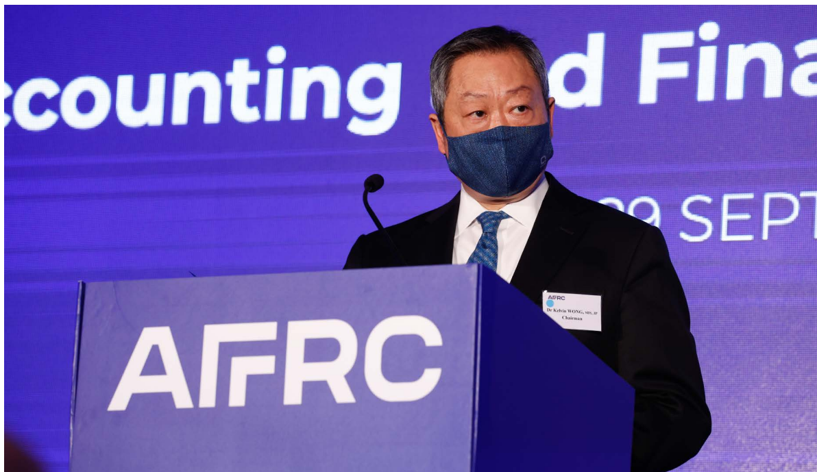
會財局主席黃天祐博士致歡迎辭