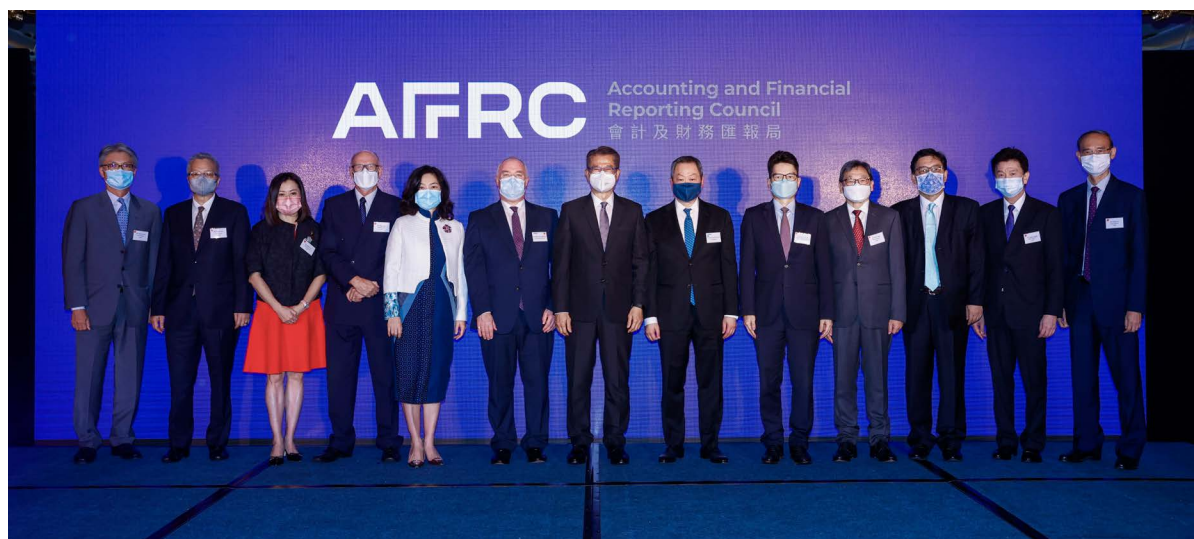
香港特別行政區政府財政司司長陳茂波先生 (中)、署理財經事務及庫務局局長陳浩濂先生 (右五)及 財經事務及庫務局常任秘書長(財經事務)甄美薇女士(左五)與會財局董事局成員合照