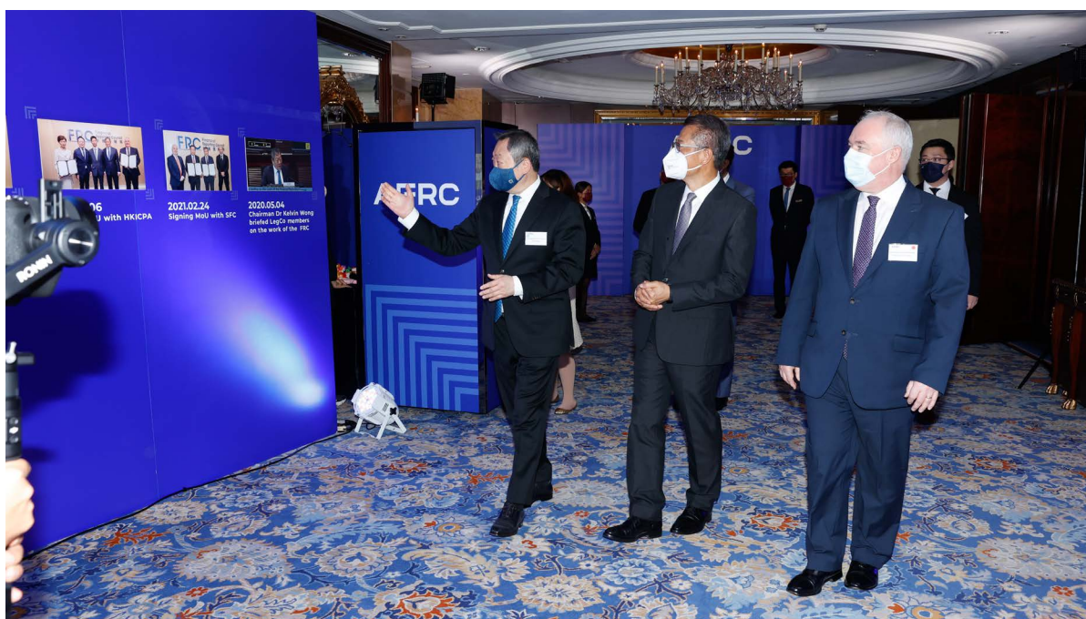
會財局主席黃天祐博士向香港特別行政區政府財政司司長陳茂波先生介紹「時光隧道」展覽